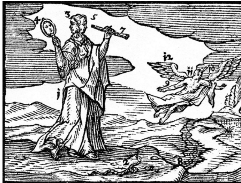
Johann Amos Comenius. Prudentia . CX de Orbis sensualium pictus . Versión latín-alemán, Nuremberg, Alemania, 1669.