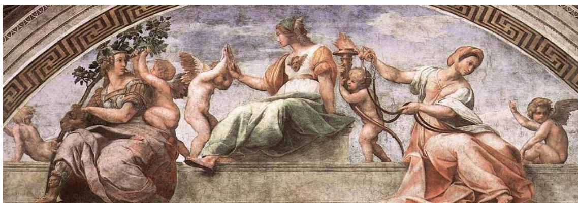
Raffaello Sanzio. Le Virtù . (ca. 1511).

Stanza della segnatura. Museo del Vaticano, Italia.