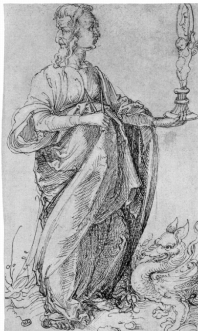
Albrecht Dürer. Prudentia (ca. 1494). Pluma y tinta en papel. París, Museo del Louvre, Cabinet des Dessins.

Poco tiempo después, como segundo caso emblemático, en los frescos confeccionados en el Vaticano, particularmente en uno que compone la Stanza della segnatura , realizado entre 1508 y 1511, Raffaello Sanzio dejó testimonio de la importancia del pasado en el conocimiento de lo contingente y lo venidero. El rostro juvenil de la prudencia que confeccionó se reconoce en el espejo al mirar el pasado, en tanto que la experiencia, como rostro en la nuca, dirige su mirada hacia el futuro.