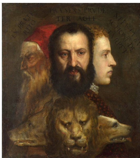
Tiziano Vecellio (ca. 1565-1570). Alegoría de la prudencia.

Galería Nacional de Londres, Inglaterra.