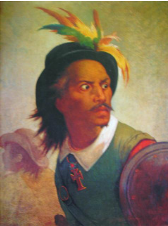
Estudo para Batalha dos Guararapes: Filipe Camarão. Vitor Meireles, c. 1874-1878. 45 X 53 cm. Óleo sobre tela. Rio de Janeiro: Acervo Museu Nacional de Belas Artes.

As relações entre pintura de História e História no oitocentos transcendiam as temáticas abordadas por ambas. A disciplina inspirou-se no exemplo da pintura para legitimar a objetividade de sua narrativa, tomando a imagem como reflexo do passado. Concomitantemente, os pintores apoderaram-se não só dos métodos de pesquisa da disciplina, mas também se apropriaram dos debates sobre concepção de História e a tarefa do historiador para definir a natureza de sua obra e de sua condição de pintor. Conforme o observado neste artigo, arte e História nos oitocentos possuíam uma estreita relação que perpassava a natureza, a função e o método de ambas – ao contrário do que se observa hoje após um longo processo de autonomização e especialização desses saberes.