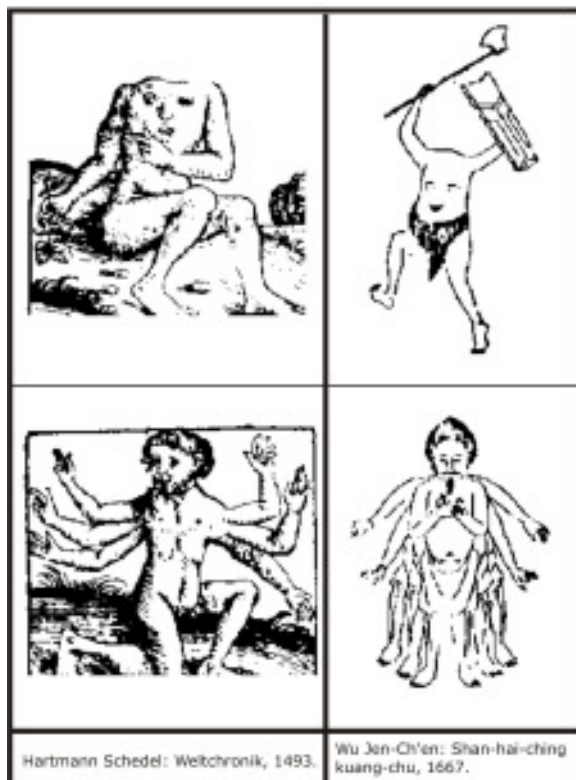
Figura 3: Representações europeia e chinesa da alteridade no começo da época moderna. Os estranhos são monstruosos, eles são mal formados e carecem da aparência humana.